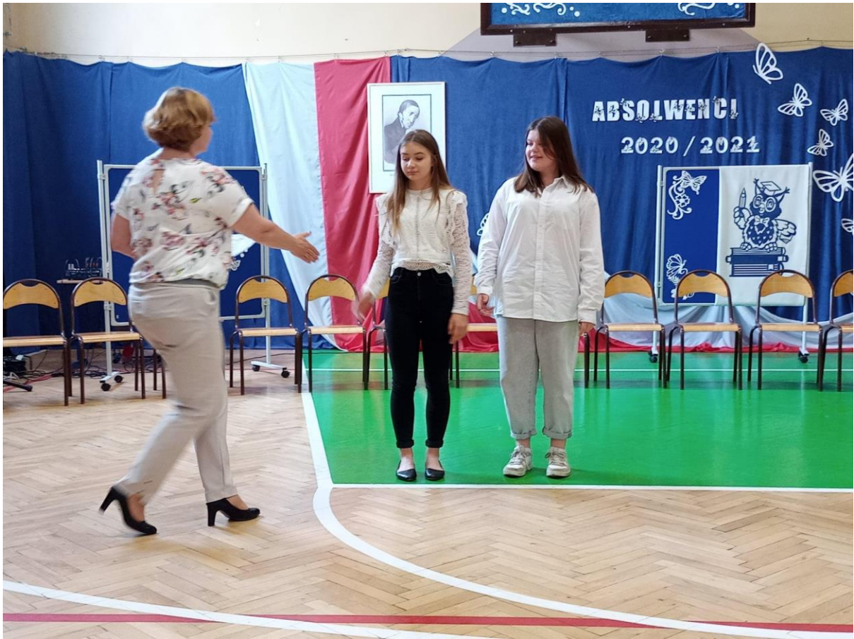
Kl. VII a i VII b